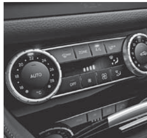
Klimatisierungsautomatik THERMATIC (580)