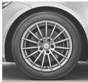
Leichtmetallräder im Vielspeichen-Design (69R)