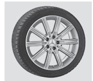
48,3 cm (19") Leichtmetallrad im 10-Speichen-Design