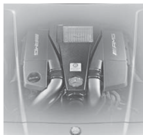
Motorabdeckung in Carbon (B14)