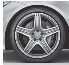
AMG Leichtmetallräder im Triple-Speichen-Design (797)