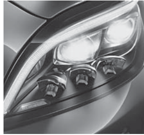
MULTIBEAM LED (642)