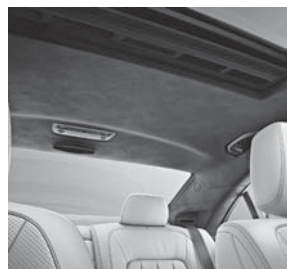
designo Innenhimmel Mikrofaser DINAMICA