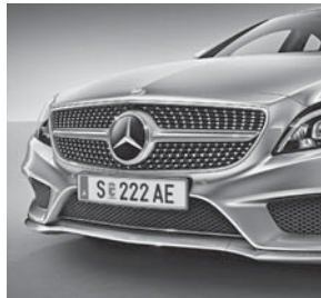
Diamantgrill in Chrom