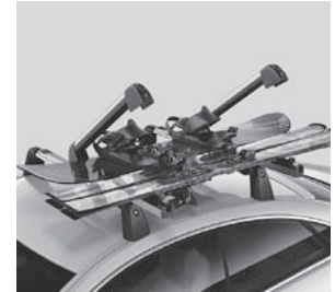
Ski- und Snowboardträger New Alustyle (Abbildung ähnlich)