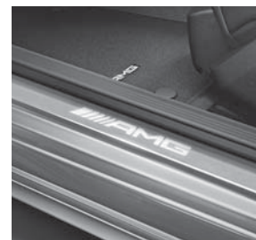
AMG Einstiegsleisten vorne weiß beleuchtet in LED-Technik (U25)