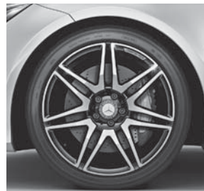
AMG Leichtmetallräder im 7-Doppelspeichen-Design (644)