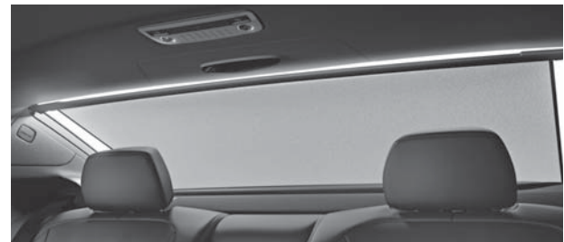
Sonnenrollo elektrisch für Heckscheibe (540)