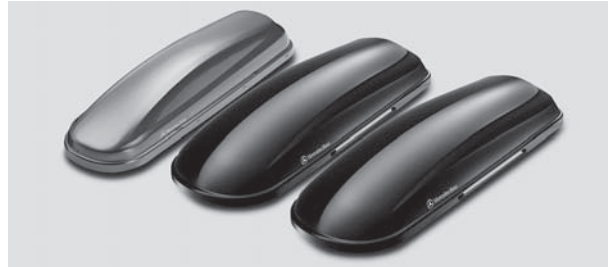
Mercedes-Benz Dachboxen 330, 400, 450, beidseitig öffnend