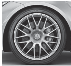
AMG Schmiederäder im Kreuzspeichen-Design (799)