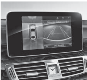
Park-Paket mit 360°-Kamera (P44)