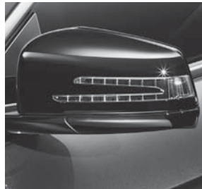
Außenspiegelgehäuse, schwarz (Abbildung ähnlich)