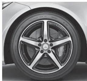
AMG Leichtmetallräder im 5-Speichen-Design (782)