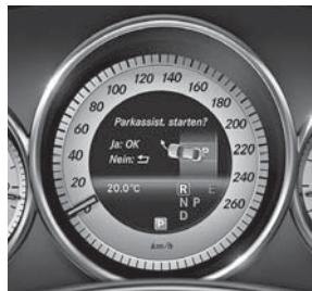
aktiver Park-Assistent (235)