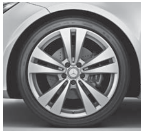
Leichtmetallräder im 5-Doppelspeichen-Design (R90)