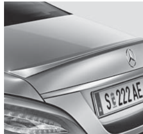
Heckspoiler (Abbildung ähnlich)