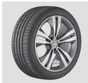
45,7 cm (18") Leichtmetallrad im 5-Doppelspeichen-Design