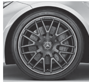
AMG Schmiederäder im Kreuzspeichen-Design (665)