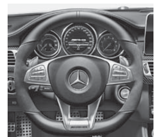
AMG Performance Lenkrad in Leder Nappa schwarz/ Mikrofaser DINAMICA (281)