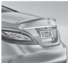
AMG Abrisskante auf Kofferraumdeckel