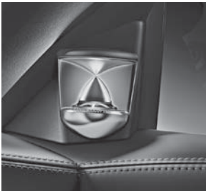
Bang & Olufsen BeoSound AMG (811)