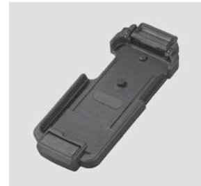
Aufnahmeschale für Apple iPhone®