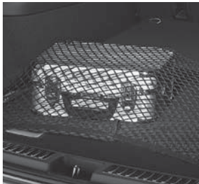
Gepäcknetz, Kofferaumboden (Abbildung ähnlich)