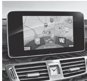
Garmin® MAP PILOT (357)