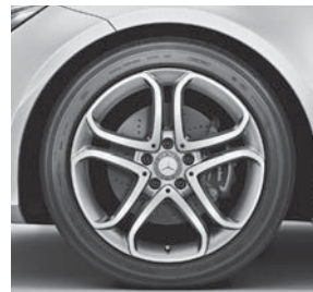
Leichtmetallräder im 5-Doppelspeichen-Design (22R)