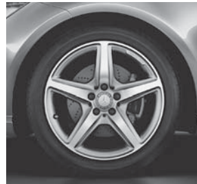
AMG Leichtmetallräder im 5-Speichen-Design (790)