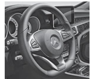
AMG Sportlenkrad mit roten Kontrastziernähten