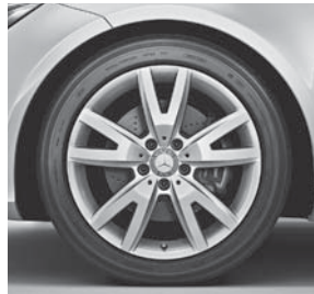
Leichtmetallräder im 5-Doppelspeichen-Design (R70)