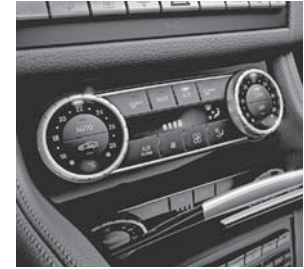
Klimatisierungsautomatik THERMOTRONIC (581)