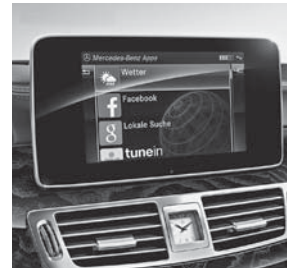
COMAND Online (531)