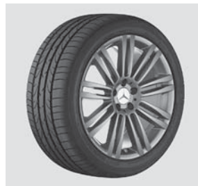
48,3 cm (19") Leichtmetallrad im Vielspeichen-Design