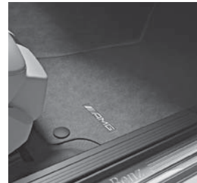
AMG Fußmatten mit »AMG« Schriftzug (U26)