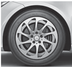
Leichtmetallräder im 10-Speichen-Design (25R)