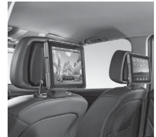
Apple iPad® 2/4 Fond-integration Plus (Abbildung ähnlich)