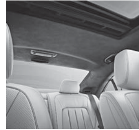
designo Innenhimmel Mikrofaser DINAMICA