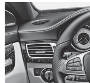
Instrumententafel in Leder Nappa