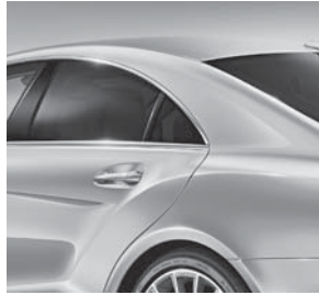
wärmedämmend dunkel getöntes Glas (840)