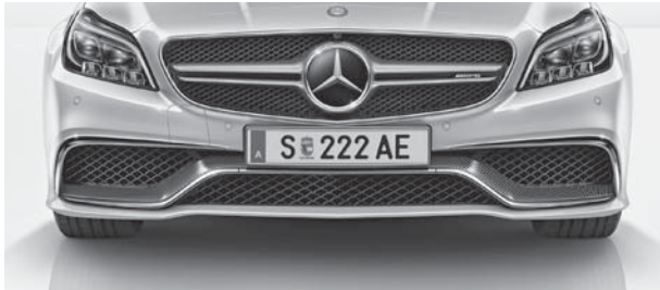
A-Wing der AMG Frontschürze in Carbon