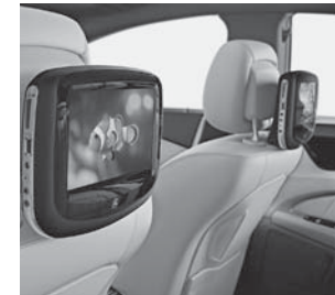
Fond Entertainment (E78)