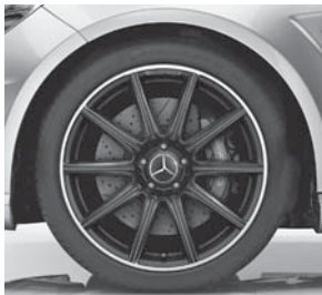
AMG Leichtmetallräder im 10-Speichen-Design (752)