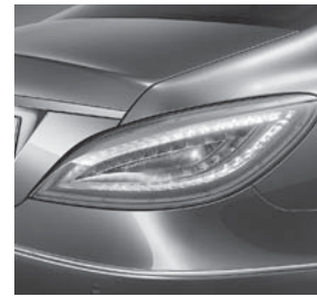
LED-Schlussleuchte mit adaptiver Lichtstärke