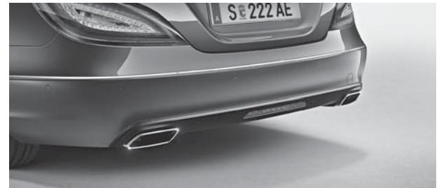
zweiflutige Abgasanlage mit eckigen, integrierten Endrohrblenden