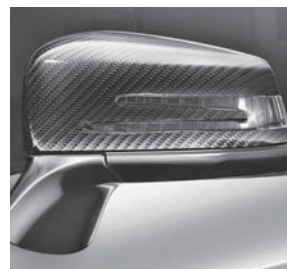
AMG Spiegelgehäuse in Carbon