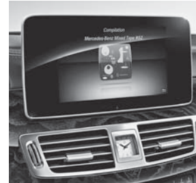
Audio 20 CD (505)