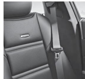
Sicherheitsgurte in Rot