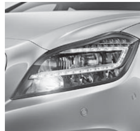
LED High Performance- Scheinwerfer (632)