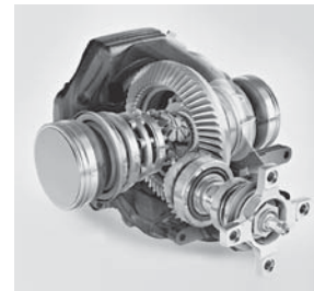
AMG Hinterachs-Sperrdifferential (471)