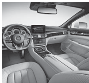
Polsterung Leder PASSION Exklusiv