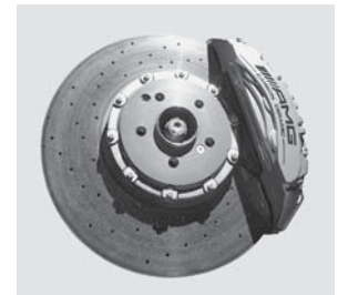
AMG Keramik-Hochleistungs-Verbundbremsanlage (B07)